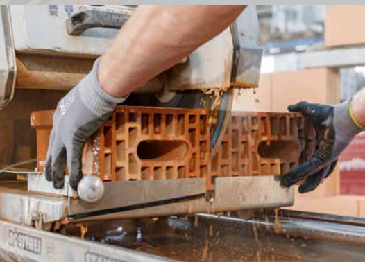
18. Découpez les blocs au moyen d'une scie à table

* Avec des murs d'un largeur de 10 cm, appliquer 1 cordon au milieu du bloc