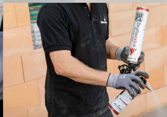
5. En cas de courtes pauses, nettoyez la tête de projection avec Dryfix cleaner