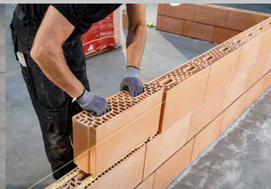
17. Posez les blocs