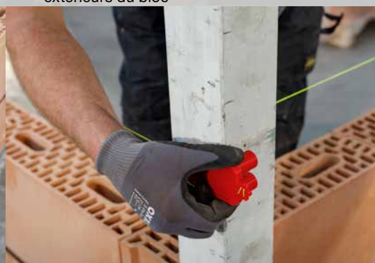
15. Appliquez le cordeau de maçon à une hauteur de \pm 2 cm sous la hauteur de la couche suivante