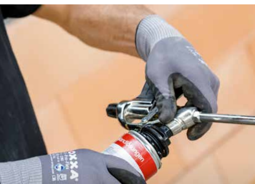
3. Vissez la bombe Dryfix extra sur la tête de projection nettoyée