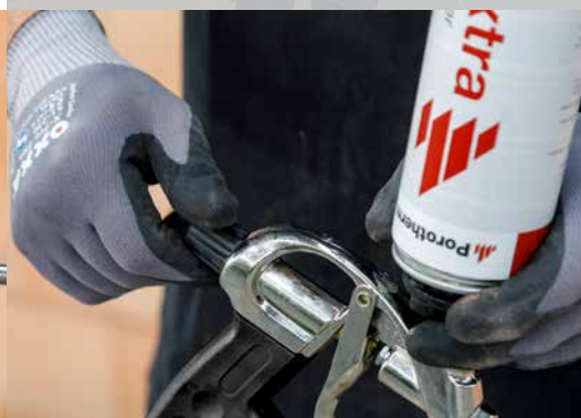
4. Réglez le débit au moyen de la vis