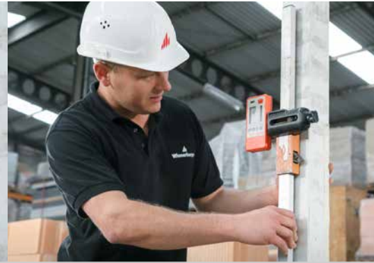
2. Mettez-les de niveau