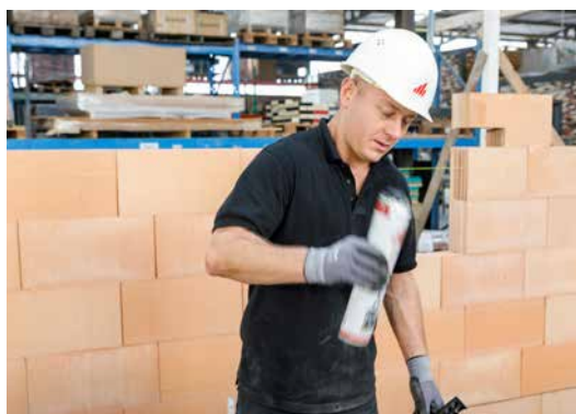
1. Agitez 20x correctement la bombe Dryfix extra