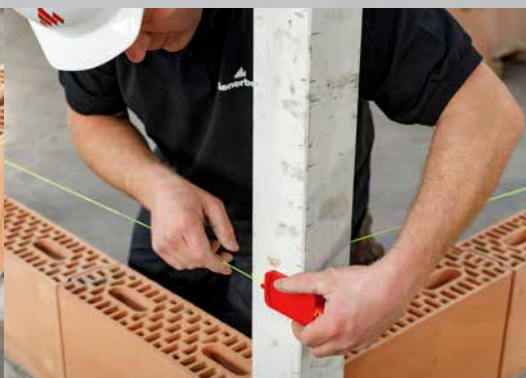
9. Appliquez le cordeau de maçon à une hauteur de \pm 2 cm sous la hauteur de la seconde couche