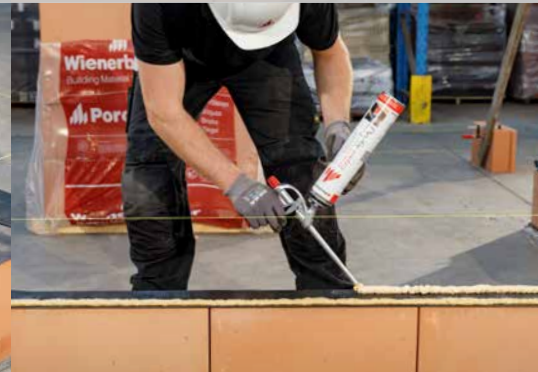
12. Appliquez 2 cordons de Dryfix extra sur la barrière anti-humidité