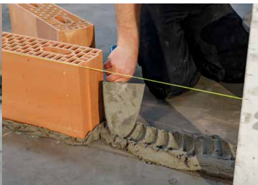
4. Maçonnez la première couche (couche d'assise)