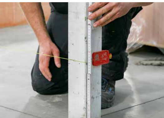
3. Placez le cordeau de maçon pour la première couche de blocs