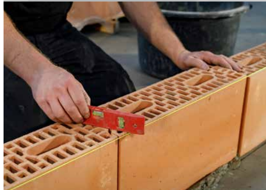
6. Contrôlez la planéité de l'assemblage à tenons et mortaises