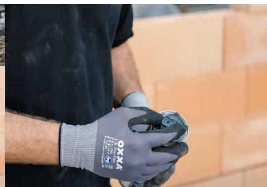
2. Retirez le clip de protection