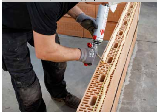
16. Appliquez Dryfix extra en 2 cordons de 3 cm de largeur, à \pm 1 cm des côtés extérieurs du bloc