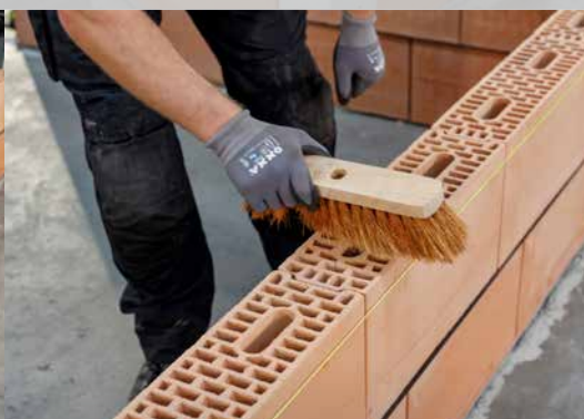
14. Brossez les blocs