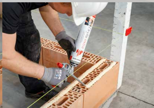
10. Appliquez Dryfix extra en 2 cordons de 3 cm de largeur, à \pm 1 cm des côtés extérieurs du bloc