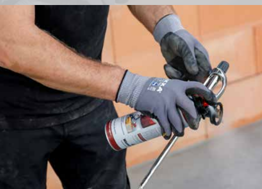
6. En cas de pauses plus longues, retirez la bombe Dryfix extra et nettoyez la tête de projection avec Dryfix cleaner