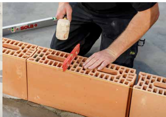
5. Contrôlez la planéité perpendiculairement au mur