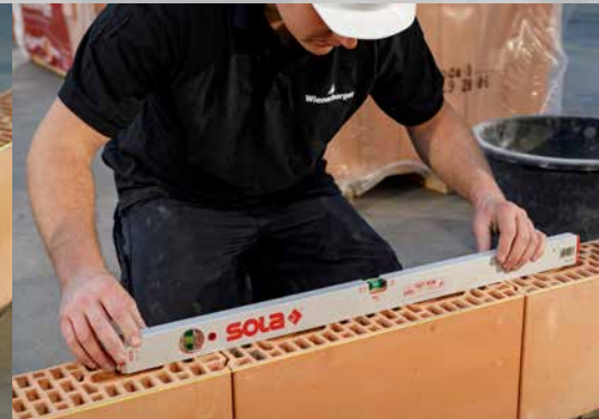
7. Contrôlez la planéité dans le sens longitudinal sur 3 blocs (longueur du niveau \geq 80 cm)