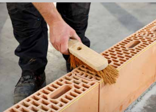
8. Brossez les blocs (répétez l'opération pour l'application de chaque couche)