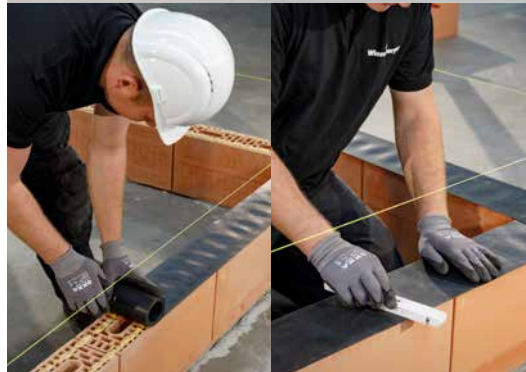
11. Placez la membrane d'étanchéité et compressez celle-ci correctement sur la mousse Dryfix extra appliquée