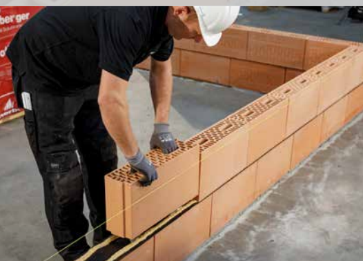
13. Posez la seconde couche de blocs