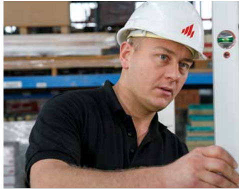
1. Installez les profilés